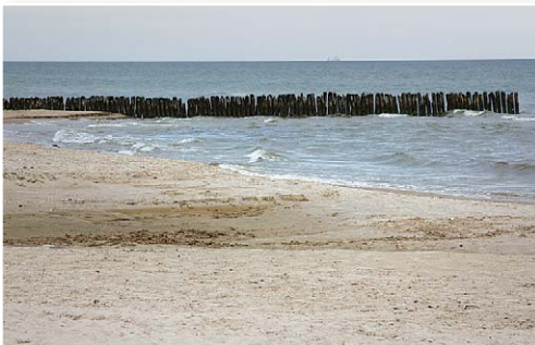
Jūra pie Košraga