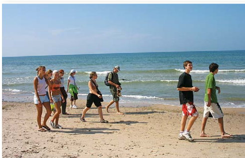
Gājieni gar jūru